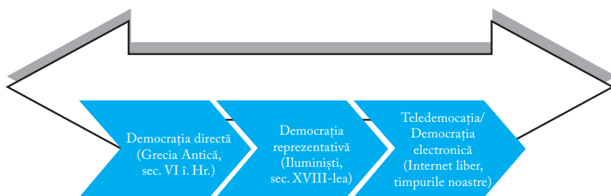
Fig.1 Evoluția istorică a democrației

dificil de aplicat în comunitățile populate din prezent, într-o lume tot mai globalizată (deși sunt exemple de succes precum democrația semi-directă din cantoanele elvețiene sau întrunirile anuale ale partidelor politice cu cetățenii, din orașul suedez Visby 9 ). Voi reveni cu un istoric al ideii de teledemocrație după o scurtă digresiune ce va conține considerații personale despre cum e tratat conceptul în spațiul virtual românesc.